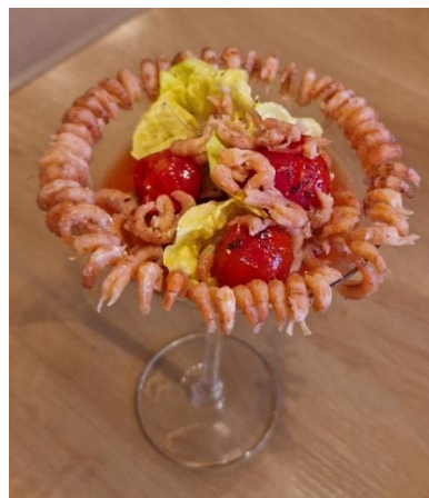
Menu April 2026 Cuisine Culinaire Maastricht